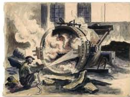
Steel Mill - Gary, Indiana